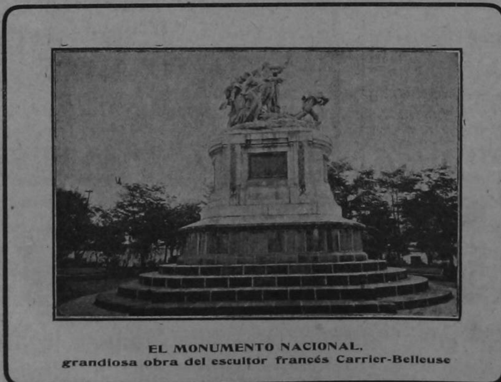
EL MONUMENTO NACIONAL, grandiosa obra del escultor francés Carrier-Belleuse

París, julio 22.—El famoso escultor y pintor Carrier-Belleuse ha muerto. Deja una colección valiosa de cuadros y esculturas y muere lleno de gloria.